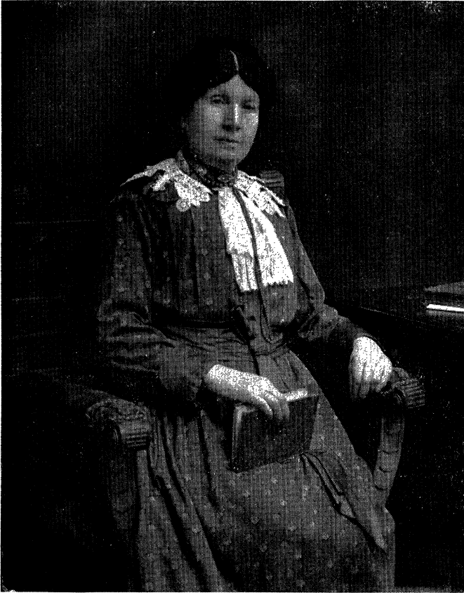
די באַבע חיה